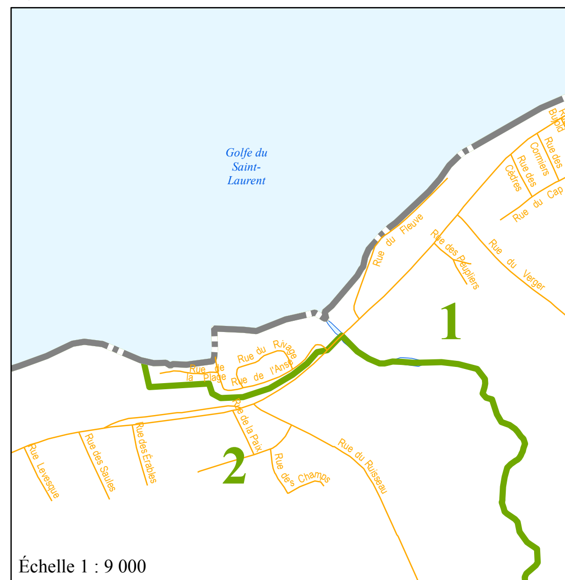
Échelle 1 : 9 000